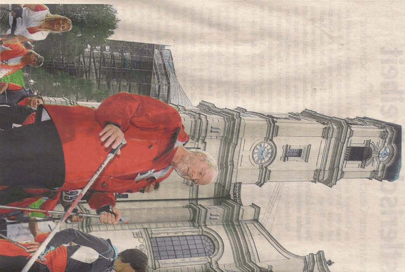
Beim vierten Nordic-Walking-Marathon in Ottobeuren ist für Sportler wieder voller Stockeinsatz geplant mit rund 700 Teilnehmern.